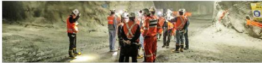
Las negociaciones que se vienen en la minería

Los Pelambres, de AMSA, y las divisiones Andina y Chuquicamata, ambas de Codelco, esperan la calificación del ente regulador.