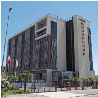
La cadena local Diego de Almagro y la mexicana City Express decidieron instalarse cerca del aeropuerto. Pronto abrirá sus puertas La Quinta Inn.

Un ejemplo de este mayor atractivo es la nueva apuesta de la compañía estadounidense Wyndham, la mayor cadena hotelera del mundo en número de recintos. La firma ya cerró su segundo hotel en Chile en menos de un mes (tras Concepción) y optó por el parque de negocios Enes, a cinco minutos de la puerta de acceso al futuro terminal internacional. Se tratará de un hotel de marca Encore by Ramada, de cuatro estrellas, 70 habitaciones y orientado al segmento corporativo y a captar pasajeros del aeropuerto.