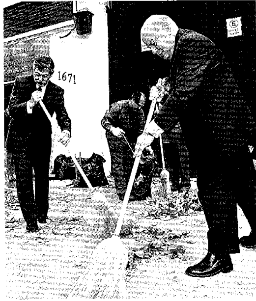
MINISTERIO DE INTERIOR

tés regionales de emergencia fueron instruidos en febrero sobre las bases del plan. Este les obligó a detectar las zonas más vulnerables de catástrofes en cada región, los sectores de riesgo y a tener un registro de obras de mitigación en esos lugares. Asimismo, ya existe un registro de albergues en todo el país. La información se actualizará cada mes.